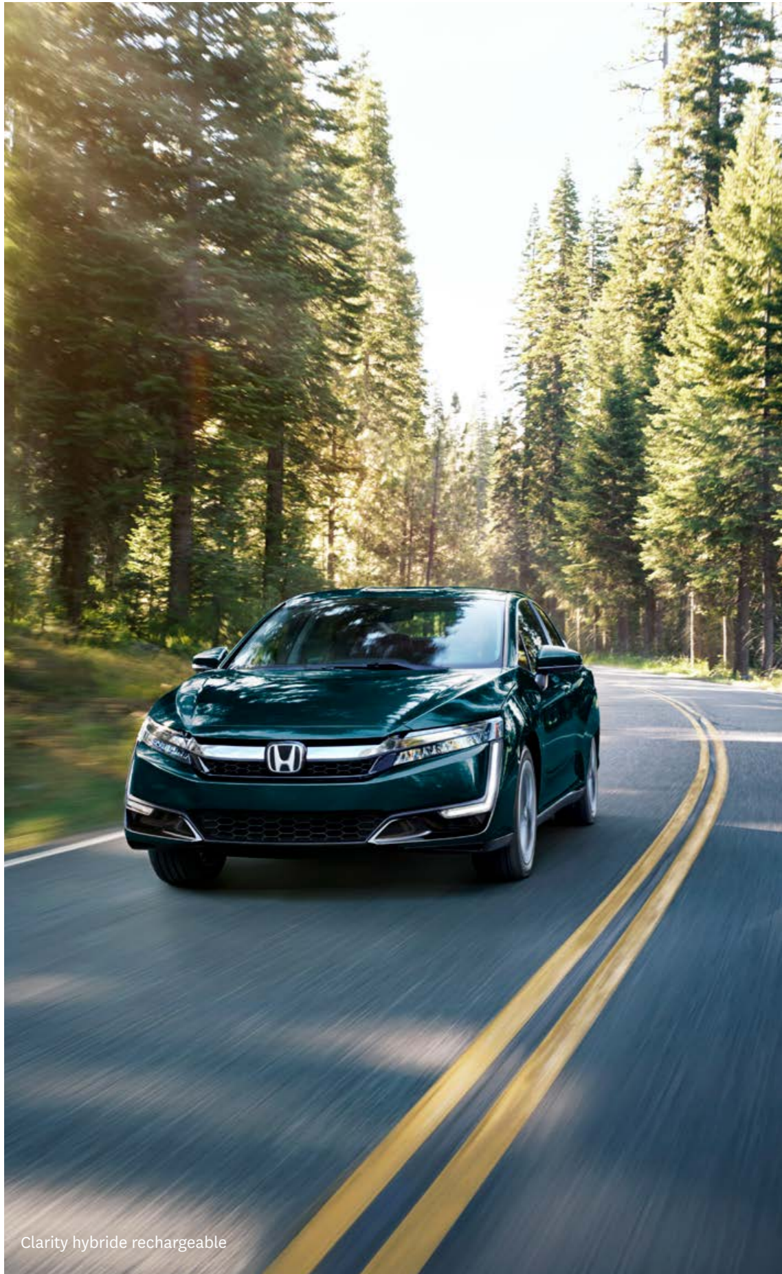
Clarity hybride rechargeable