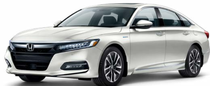
Orchidée blanche fini nacré