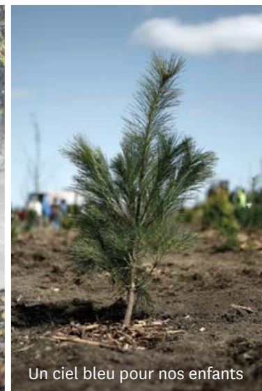
Un ciel bleu pour nos enfants