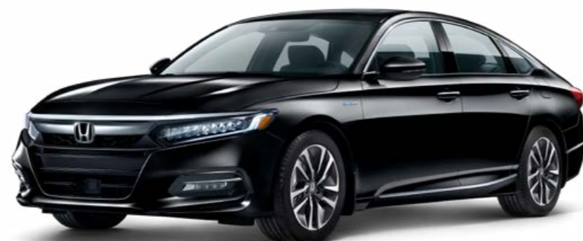
Noir cristal nacré