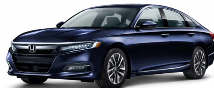
Bleu obsidienne nacré